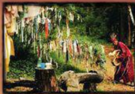
Geistbaum-Ritual; Tücher als Botschaften